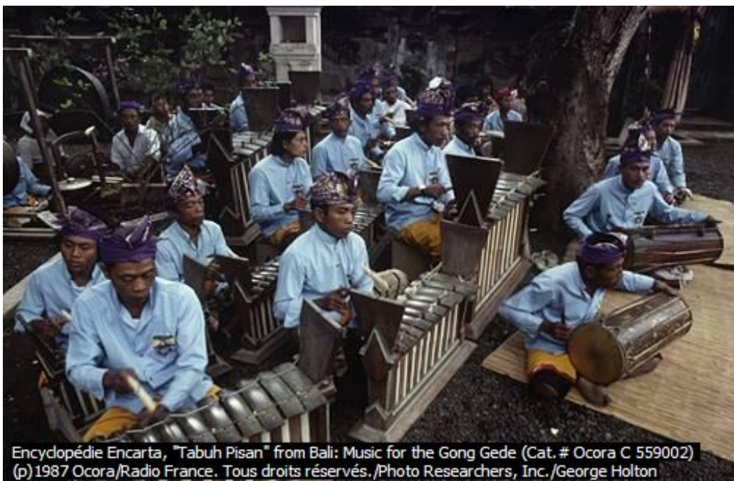
Encyclopédie Encarta, "Tabuh Pisan" from Bali: Music for the Gong Gede (Cat. # Ocora C 559002) (p)1987 Ocora/Radio France. Tous droits réservés.

Le Gamelan est un ensemble d'instruments inséparables, dont le modèle premier est constitué de percussions métalliques, de gongs et carillons, avec ou sans métallophones à lames.