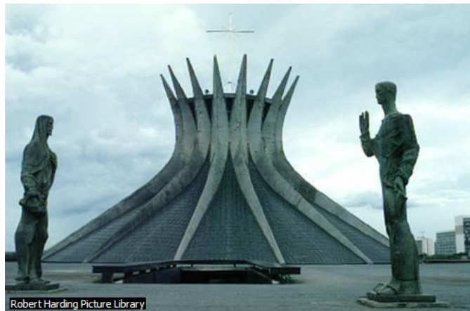
Niemeyer, Cathédrale de Brasilia

Le Brésil couvre la moitié de l'Amérique du Sud. Il est recouvert par la forêt amazonienne.